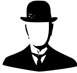
Figuur 2: Voorbeeld van een plaatje dat ingevoegd is met het commando includegraphics

Het kan gebeuren dat er in het bewijs een berekening wordt gevraagd. Dan is het mooi dat \text{\LaTeX} speciaal gemaakt is om mooi en relatief simpel wiskundige notaties te gebruiken. Een en ander wordt duidelijk gemaakt in de volgende formule: